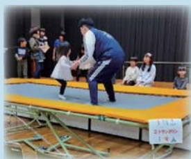
子どもに人気のトランポリン