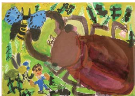
アドベンチャー賞