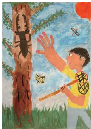
アドベンチャー賞