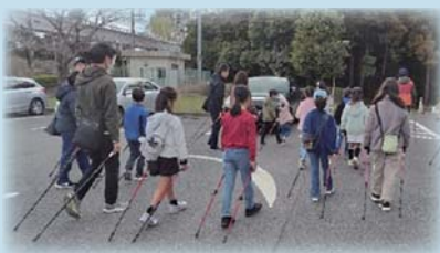
ノルディックウォークを体験